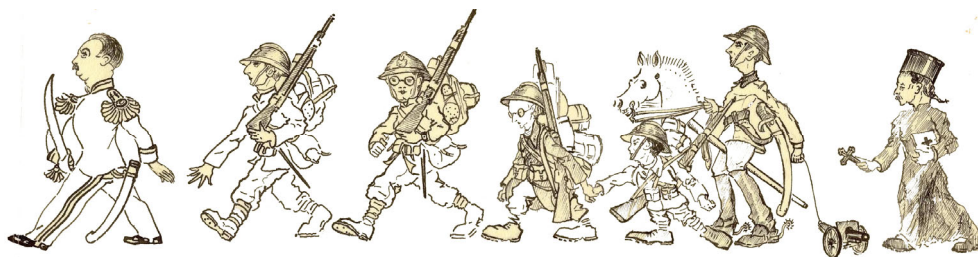
Fig. 3 – Parte din „Trupa” Institutului de Psihologie din Cluj 22 .